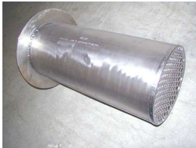
Mezclador en Titanio con aro, para insertar en tubería

Desde 1984 expertos en filtración y mezcla de fluidos